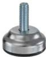
NCH 900 Nivelador chapa 5/16" x 1" (35mm)