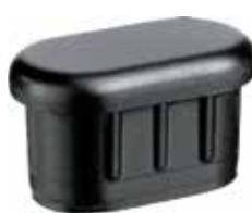
PO 35 Oblonga 20 x 35 interna