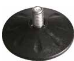
NR 212 Pé nivelador redondo 2 1/2" 3/8" x 3/4" (63 mm)