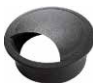
PF 46 Passa-fio 46 mm p/ tampo 18 mm