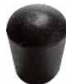
PI 240 Pont. externa 1/4" PVC