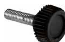
MN 30 M Mini parafuso M5 x 20 (15 mm)