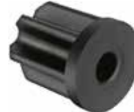
BU 20 Bucha 1" furo 6mm