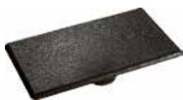
TTR 30 Tapa tomada retangular