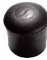
PI 340 Pont. externa 3/4" PVC