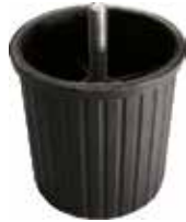
NC 72 Pé nivelador cônico H72 mm 5/16" x 1/2"