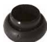
PB 580 Bola 5/8"