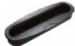
PU 115 Puxador oblongo Milenium