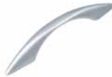
PU 60 B Puxador Veneza prata fosco (96 mm)