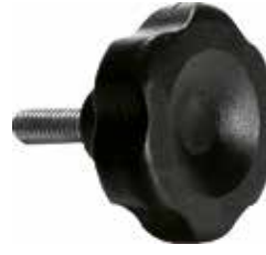
MG 23 Grande 5/16" x 1" (45 mm)