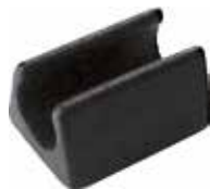
SC 12 Sapata p/ arame 1/2" ou 7/16"