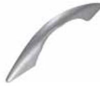
PU 50 B Puxador mesa (96 mm) prata fosco