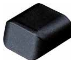
PO 28 Ponteira 29 x 58 externa slim