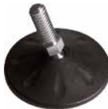
NRA 600 Pé nivelador articulado 2 1/2" 5/16" x 7/8" (63 mm)