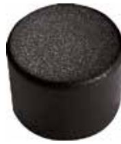
PE 58 Red. externa 5/8" PE