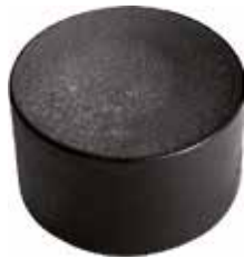
PE 1 Red. externa 1" PE