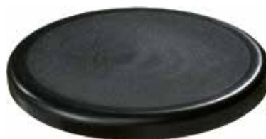
AB 40 Assento de banqueta