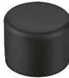
PE 118 Red. externa 1 1/8" PE