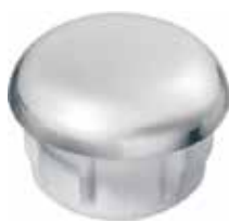
PI 120.CR Ponteira interna 7/8" Cromada