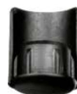
PI 115 Red. Interna c/ calço 3/4"