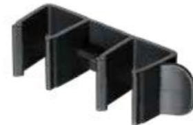
UC2020 União Cadeira 20x20