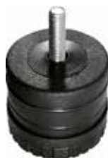
SR 250 Sapata conjugada 2 1/2"