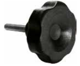
MG 12 Grande 1/4" x 1" (45 mm)