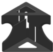
CER 130 Cantoneira embalagem regulável 69 a 130 mm