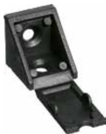
CM 15 Cantoneira de montagem pequena