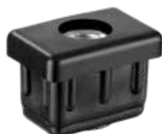
PP 45 Bucha 30 x 20 Ø 3/8"