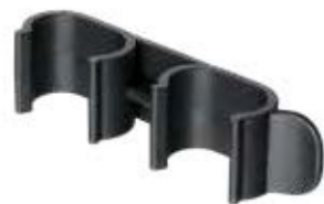
UC1630 União Cadeira 16x30