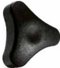
MT 12 Três pontas 1/4" x 1" (45 mm)