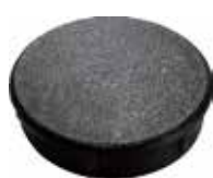
PI 190 Ponteira interna de 2"