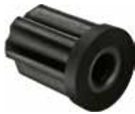
BU 346 Bucha 3/4" furo 6mm