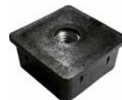
PP 70 Bucha 40 x 40 rosca 3/8"