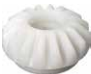
ENP 30 Engrenagem 45° 27,5 mm