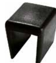
AP 10 Apoio p/ tubo de 20 mm