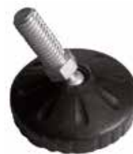
NRA 500/A Pé nivelador articulado 2" 3/8" x 7/8" (50 mm)