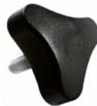
MT 82 Três pontas 3/8" x 1" (45 mm)