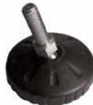
NRA 500 Pé nivelador articulado 2" 5/16" x 7/8" (50 mm)