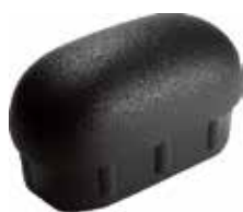
PO 50 Oblonga 40 x 77 interna