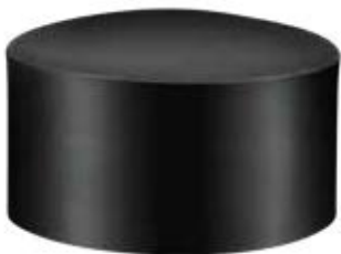
PI 201 Ponteira 2" externa PVC