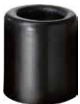
BT 114 Batente 1 1/4" PVC