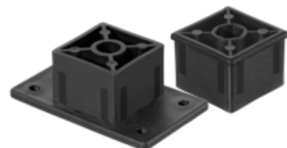
CJB4040 Conjunto Bucha Superior/Inferior 40x40