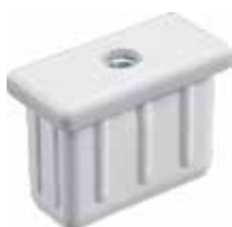
PP 50 Bucha 40 x 20 rosca 1/4"