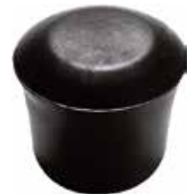
PI 112 Pont. externa 1 1/2" PVC