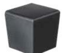
PI 290 Ponteira 40x40 externa pvc