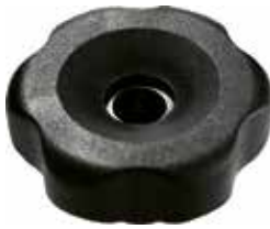
MG 84 Grande c/ porca injetada 5/16" (45 mm)