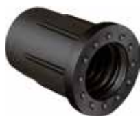
BC 380 Bucha 3/8" rosca plástica