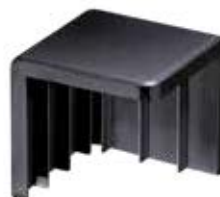
CE 80 Cantoneira embalagem 80 x 80