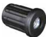
BR 70 Bucha 7/8" rosca 5/16"