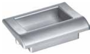
PU 40 B Puxador Madri prata fosco