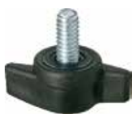
BO 50 Borboleta 1/4" x 1/2"