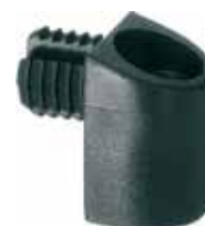
DM 25 Dispositivo de montagem trapézio