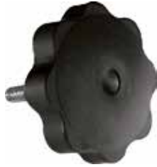
MA 20 M Margarida 5/16" x 1" (65 mm)