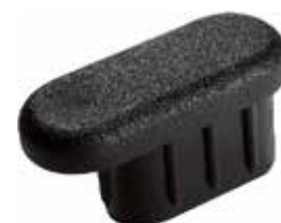
PO 09 Oblonga 16 x 30 longa