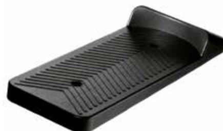
PD 120 Pedal furo 1/4"