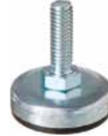
NCH 100 Nivelador chapa 3/8" x 1" (35 mm)