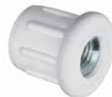
BR 130 Bucha redonda de 1 1/4" rosca 3/8"