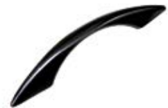
PU 60 Puxador Veneza (96 mm)