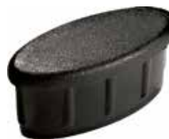
PI 2045 Eliptica 20 x 45 interna