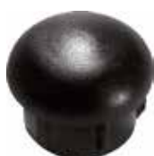
PI 110 Red. interna 3/4"