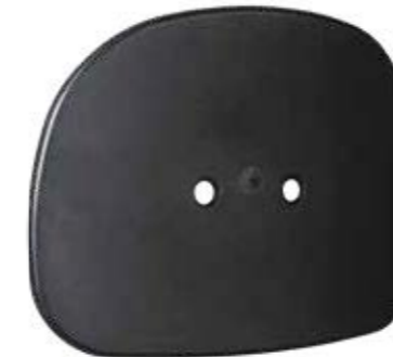
CES45 Capa Encosto Secretária