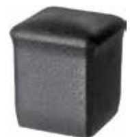
PI 200 Quadrada externa 16 x 16 PVC