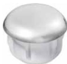
PI 130.CR Ponteira interna 1" Cromada