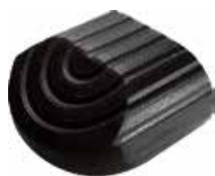
PO 55 Oblonga 40 x 77 externa