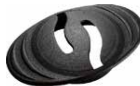
PF 80 Passa-fio 79 mm p/ tampo 25 mm