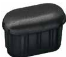
PO 06 Ponteira 16 x 30 abaulada