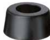
BT 12 Batente 1/2" PVC