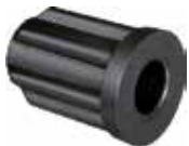
BR 65 Bucha 3/4" redução 5/16" especial