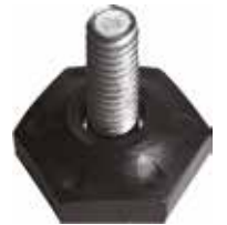
NS 10 Pé nivelador sext. 5/16" x 7/8" (31 mm)