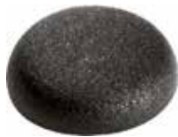
TP 10 Tampa para parafuso 13 mm