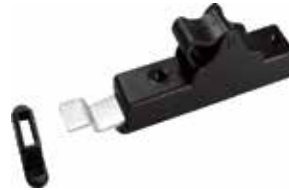
FA 250 Fecho p/ armário