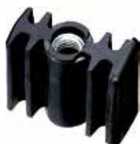
BI 50 Bucha 50 x 20 rosca inclinada 3/8"