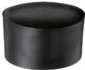
PI 212 Pont. externa 2 1/2" PVC