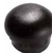
PI 107 Red. interna 5/8"