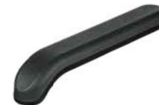
BAT 120 Braço Auditório