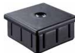
PP 89 Bucha 50 x 50 rosca 5/16"