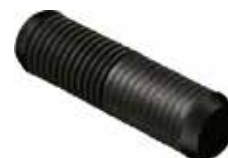
CP 20 Cavilha 8 x 30