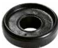
RO 19 Roldana rebite para corredeira