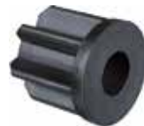
BU 110 Bucha 1" redução 10