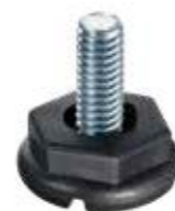
PNS100 Pé nivelador 5/16X3/4