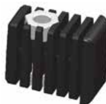
PPL 50 Bucha 30 x 20 porca lateral 1/4"