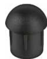
PLE 05 Ponteira interna 3/4" Abaulada