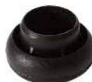
PB 780 Bola 7/8"