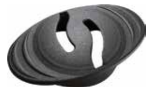
PF 79 Passa-fio 79 mm p/ tampo 18 mm