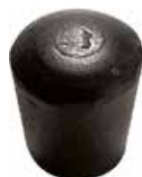
PI 516 Pont. externa 5/16" PVC