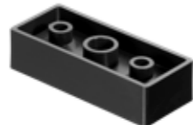
DTM 15 Distanciador Mesa 60X25X15