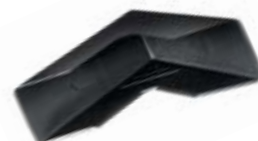
CE 50 Cantoneira 65 x 65 x 25 fechada para embalagem