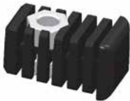
PPL 45 Bucha 20 x 20 porca lateral 1/4"