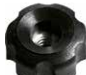
MP 20 F Pequeno c/ porca 1/4" (20 mm)