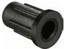
BU 586 Bucha 5/8" furo 6mm