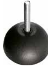
PME 234 Pé nivelador semi-esférico 5/16" x 1 3/4"