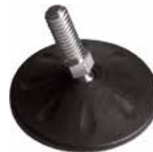
NRA 600/A Pé nivelador articulado 2 1/2" 3/8" x 7/8" (63 mm)