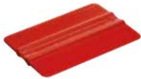
ESP 107 Espátula comum 10 x 7