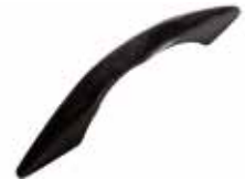
PU 50 Puxador mesa (96 mm)