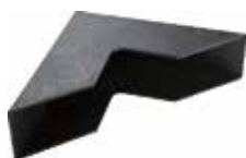
CT 7070 Cantoneira 70 x 70 x 18 fechado para embalagem