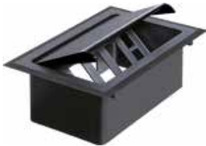
CXT 4P Caixa de tomadas 4 pontos