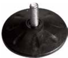
NR 212/Q Pé nivelador redondo 2 1/2" 5/16" x 3/4" (63 mm)