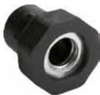
BC 20 Bucha 5/16" rosca metálica