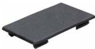
TTM 10 Tapa tomada padrão novo