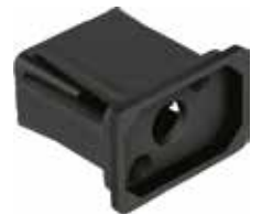
BE 3020 Bucha 30 x 20 expansiva