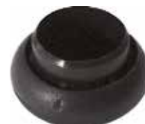
PB 100 Bola 1"