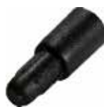
CR 22 Apoio para prateleira pequeno