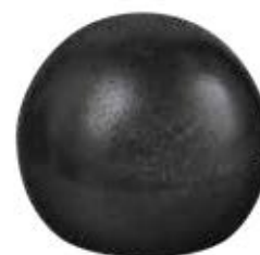
PM 5878 Ponteira mancebo 5/8" e 7/8"