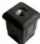
PP 10 Bucha 20 x 20 rosca 1/4"