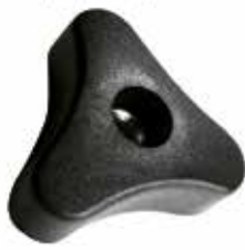
MT 99 Três pontas porca 1/4" (45 mm)