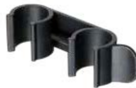
UC78 União Cadeira 7/8"