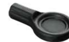
PX 08 Puxador flange