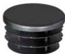
PI 132 S Ponteira 1 1/4" interna sanfonada