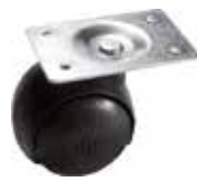
RE 30 CH Rodízio 30 mm chapa 30 x 45