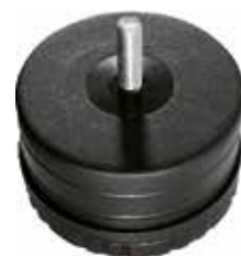
SR 400 Sapata conjugada 4"