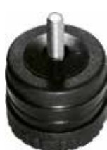
SR 200 Sapata conjugada 2"