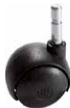
RE 38 Rodízio 38 mm