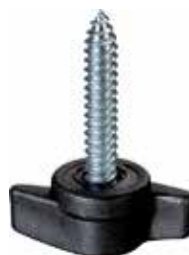
BO 79 Borboleta autoatarrachante 6,3" x 34mm