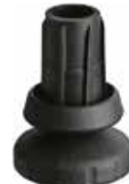
SA 341 Sapata articulada 3/4" (1,90mm)