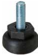
NR 800 Pé nivelador redondo 1/2" x 1 1/4" (38 mm)