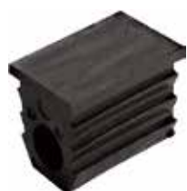
PI 40 Ponteira 30 x 20 P/ rodizio AE 3/8"