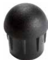
PLE 10 Ponteira interna 7/8" Abaulada