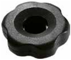
MG 85 Grande c/ porca injetada 3/8" (45 mm)