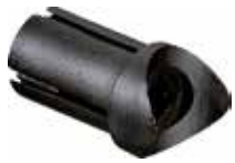
BEC 34 Bucha expansiva curva 3/4"