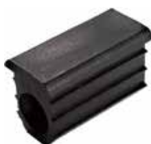
PI 61 Ponteira 40 x 20 P/ rodizio AE 1/2"