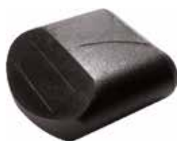
PO 30 Oblonga 20 x 58 externa