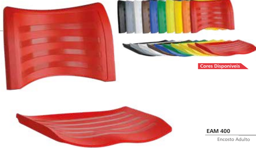
EAM 400 Encosto Adulto