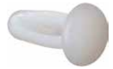
RP 12 Rebite nylon