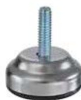
NCH 800 Nivelador chapa 1/4" x 1" (35mm)