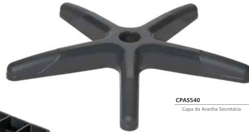
CPAS540 Capa da Aranha Secretária