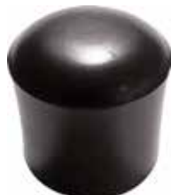
PI 1000 Pont. externa 1" PVC