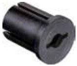
BER 78 Bucha expansiva reta 7/8"