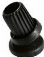
SA 78 Sapata articulada 7/8"