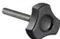
MTG 30 Manipulo triângulo 1/4" x 1" (31 mm)