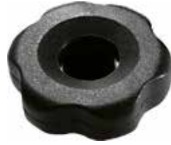
MG 83 Grande c/ porca injetada 1/4" (45 mm)