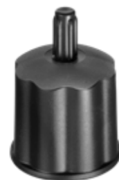
PFC35 Pé Fixo Caixa Plástico