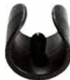
SC 58 Sapata p/ cadeira p/ tubo 5/8"