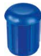
PI 112E Ponteira FDE 1 1/2"