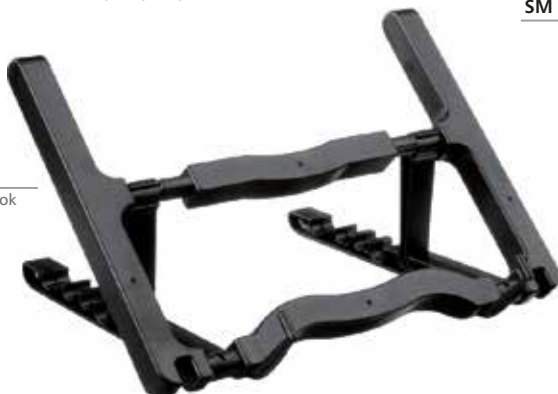
ST 35 Suporte para notebook