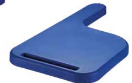
PCLD Prancheta lateral direita