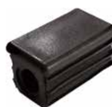
PI 100 Ponteira 50 x 30 P/ rodizio AE 3/8" ou 1/2"