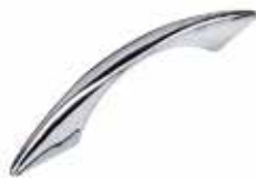
PU 60 A Puxador Veneza prata brilhante (96 mm)