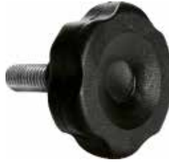
MG 43 Grande 3/8" x 1" (45 mm)