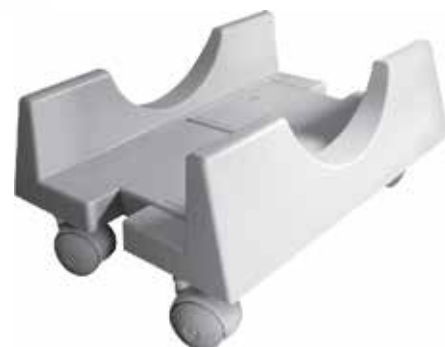
PC 310 Suporte para CPU