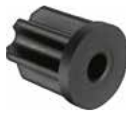
BU 786 Bucha 7/8" furo 6mm