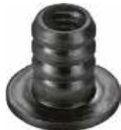
BC 40 Bucha redonda de 1" rosca 5/16" plástica