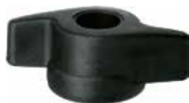
BO 17 Borboleta porca 5/16"