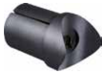
BEC 1 Bucha expansiva curva 1"