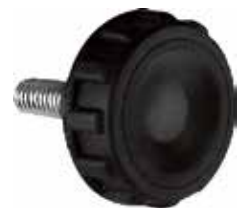
MM 10 Médio 5/16" x 3/4" (35 mm)