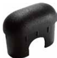
PO 25 Oblonga 29 x 58 interna