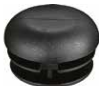
PI 110 S Ponteira 3/4" Sanfonada