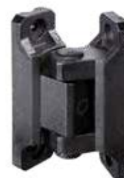
DRP 80 Dobradiça mola