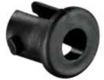
BPT 34 Bucha portas trava 3/4"