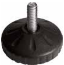
NR 200 Pé nivelador redondo 2" 5/16" x 3/4" (50 mm)