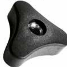
MT 100 Três pontas porca 5/16" (45 mm)