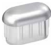
PO 06.CR Ponteira 16 x 30 abaulada cromada