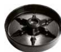
BC 300 Bucha de 3" rosca 3/8"