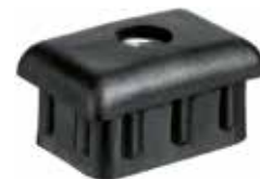
PP 30 Bucha 30 x 20 rosca 1/4"