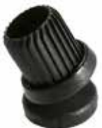
SA 1 Sapata articulada 1"