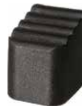
SEAE 4022 Sapata para pé de escada alumínio 40 x 22