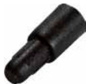
CR 20 Apoio para prateleira