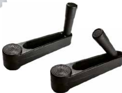
MR 200 Manivela retrátil furo 8,10 ou 12 mm