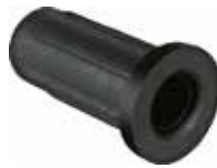
BU 126 Bucha 1/2" furo 6mm