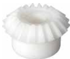
ENG 40 Engrenagem 45° 40 mm