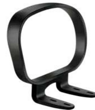
BRS 300 Braço fixo Corsa Plus