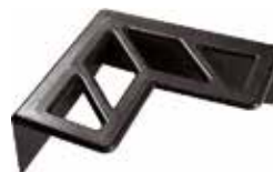
CE 40 Cantoneira 65 x 65 x 25 aberto para embalagem