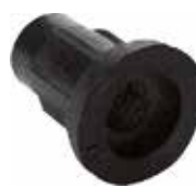
BC 05 Bucha 1/4" rosca plástica