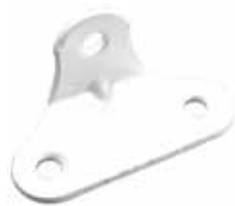
CN 150 C