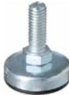
NCH 200 Nivelador chapa 5/16" x 1" (35 mm)