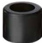
BT 34 Batente 3/4" PVC