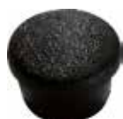
PI 103 Red. interna 1/2"