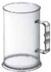
CNC 550 Caneca 550