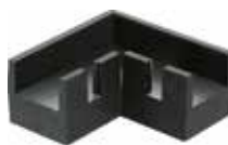
SL 45 Sapata L para arquivo com rosca 1/4"