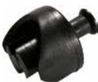
MC 10 Meia-cana redonda p/ tubo 3/4" ou 7/8"