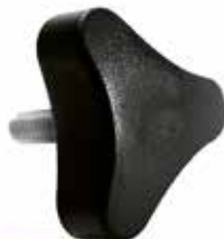
MT 50 Três pontas 5/16" x 3/4" (45 mm)