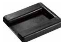
CS 20 Capa p/ suporte de microondas (20 x 20)