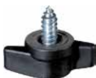
BO 78 Borboleta autoatarrachante 6,3" x 13mm