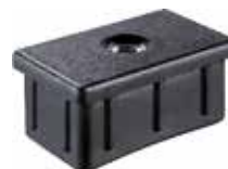
PP 80 Bucha 50 x 30 rosca 5/16"