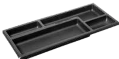
PTC 300 Porta treco