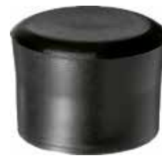
PI 134 Pont. externa 1 3/4" PVC