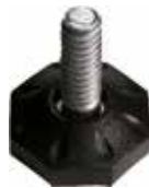
NOM 12 Pé nivelador mini 1/4" x 3/4" (18 mm)