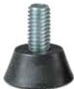
PNZ 300 Pé nivelador triângulo 3/8"x 1"