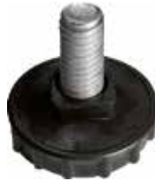
NR 10 Pé nivelador redondo 3/8" x 3/4" (34 mm)