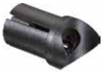
BEC 78 Bucha expansiva curva 7/8"