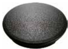
PI 170 Red. interna 4"