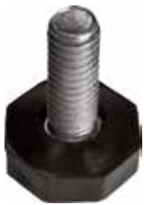
NT 30 Pé nivelador oitav. 3/8" x 1" (28 mm)