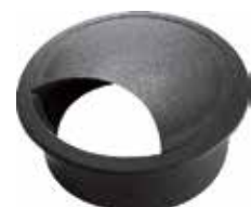
PF 15 Passa-fio 60 mm p/ tampo 25 mm