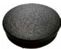
PI 160 Red. interna 3"