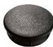
PI 150 Red. interna 2 1/2"