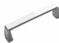
PU 20 A Puxador alça (96 mm) prata brilhante