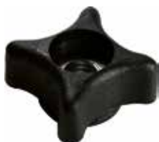
BE 30 Borboleta estela de 3/8"