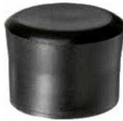
PI 201 Pont. externa 2" PVC