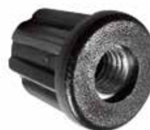
BR 100 Bucha redonda de 1" rosca 3/8"