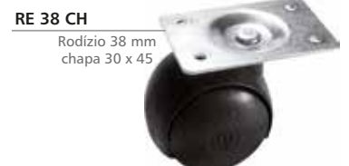
RE 38 CH Rodízio 38 mm chapa 30 x 45