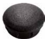
PI 137 Red. interna 1 1/2"