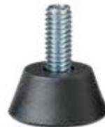
PNZ 200 Pé nivelador triângulo 5/16"x 1"