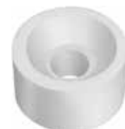
SP 10 Suporte para prateleira 10 x 15