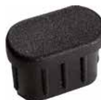
PO 08 Oblonga 16 x 30 grau