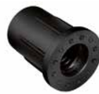
BC 516 Bucha 5/16" rosca plástica