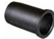
BU 134 Bucha 1" redução 3/4"