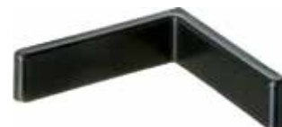
SPL 40 Sapata L estante 40 mm