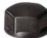
CLM 10 Calota M10