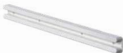
CDF 255 Corrediça friso