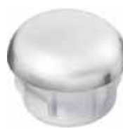
PI 110.CR Ponteira interna 3/4" Cromada