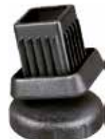
SA 20 Sapata articulada 20 x 20