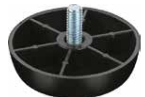
NR 60 Pé nivelador redondo 5/16" x 3/4" (60mm)