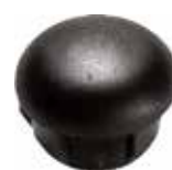
PI 120 Red. interna 7/8"