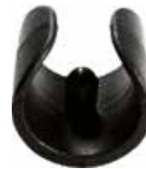
SC 50 Sapata p/ cadeira p/ tubo 3/4" a 1"