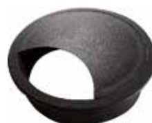
PF 10 Passa-fio 60 mm p/ tampo 18 mm