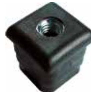
PP 20 Bucha 25 x 25 rosca 5/16"