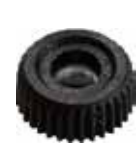
MN 30 F Mini porca M5 (15 mm)