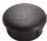
PI 132 Red. interna 1 1/4"