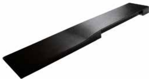
FG 10 Fronte de Gaveta 397 x 104 mm