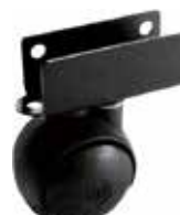
RE 30 CHU Rodízio 30 mm chapa U 15 mm