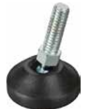
NRA 200 Pé nivelador articulado 5/16" x 7/8" (34mm)