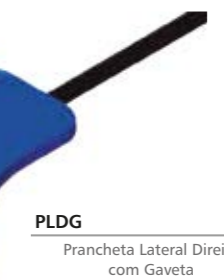
PLDG Prancheta Lateral Direita com Gaveta