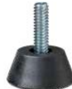
PNZ 100 Pé nivelador triângulo 1/4"x 1"