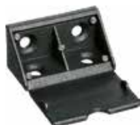
CM 25 Cantoneira de montagem grande