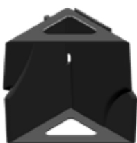
CER 67 Cantoneira embalagem regulável 35 a 67 mm