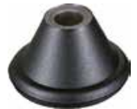
PS 14 Ponteira Sargento 1/4"