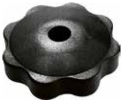
MA 20 F Margarida porca Injetada 5/16" (65 mm)