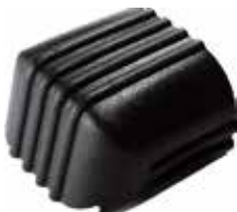
PO 27 Oblonga 29 x 58 externa