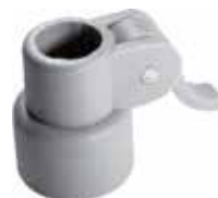
CG 12 Conexão gatilho 3/4" para 1/2"