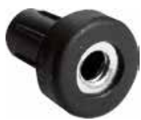
BC 10 Bucha 1/4" rosca metálica