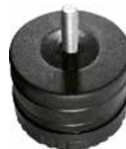
SR 300 Sapata conjugada 3"