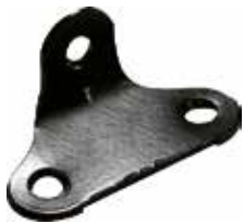
CN 150 D