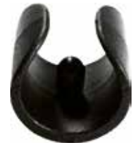
SC 60 Sapata p/ cadeira p/ tubo 1" a 1 1/4"