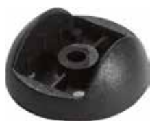
CHU 15 R Chapa U redonda (15 mm)