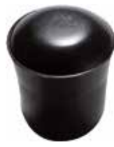
PI 780 Pont. externa 7/8" PVC