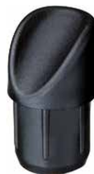
PIG 1 Ponteira 1" grau