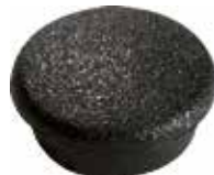
TF 12 Tapa furo 12 mm