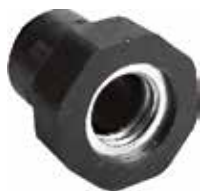
BC 25 Bucha 3/8" rosca metálica