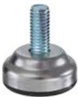
NCH 950 Nivelador chapa 3/8" x 1" (35mm)