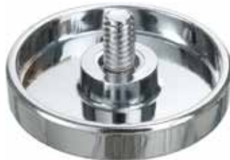
DV 44 Distanciador de Vidro 1/4" x 1/4"