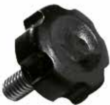
MP 20 Pequeno 1/4" x 1/2" (20 mm)