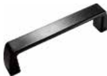
PU 20 Puxador alça (96 mm)