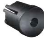
BEP 34 Bucha 3/4" expansiva s/ porca