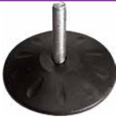
NR 312 Pé nivelador redondo 3 1/2" 3/8" x 1 3/4" (89 mm)