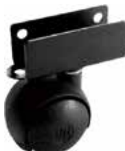
RE 38 CHU Rodízio 38 mm chapa U 15 mm