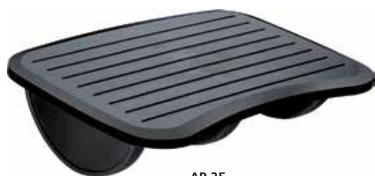
AP 25 Apoio para pés