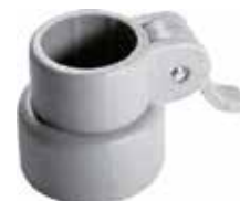
CG 18 Conexão gatilho 1" para 3/4"