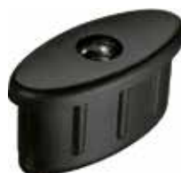
BUE 25 Bucha elíptica 20 x 45 rosca 5/16"