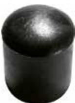
PI 220 Pont. externa 1/2" PVC