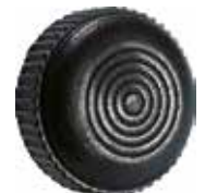
MP 30 Recartilhado 1/4" x 1/2" (30 mm)