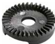
CA 20 Catraca