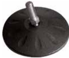
NRA 800 Pé nivelador articulado 3 1/2" 3/8" x 7/8" (89 mm)