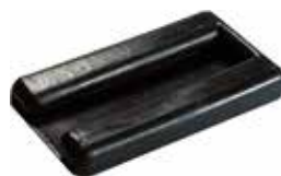
CS 10 Capa p/ suporte de TV (16 x 16)