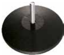
NR 130 Sapata niveladora 3/8" x 2" (130 mm)