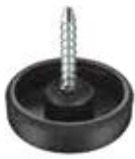
SP 22 Sapata prego (22 mm)