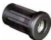
BR 69 Bucha 3/4" rosca 1/4"