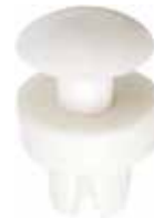
BT 10 Batoque para Gaveteiro