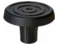
BT 26 Batoque p/ pé box