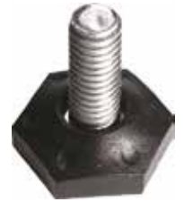
NS 20 Pé nivelador sext. 3/8" x 1" (31 mm)