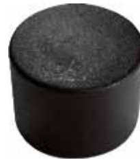
PE 34 Red. externa 3/4" PE