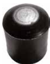
PI 380 Pont. externa 3/8" PVC