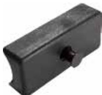
MC 20 Meia-cana reta p/ tubo 7/8" ou 1"