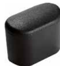
PO 22 Oblonga 16 x 30 externa