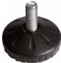
NR 200/G Pé nivelador redondo 2" 3/8" x 3/4" (50 mm)