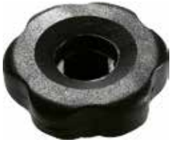
MG 80 Grande vazado 1/4" (45 mm)