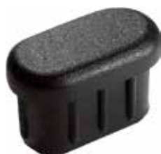
PO07 Oblonga 16 x 30 interna