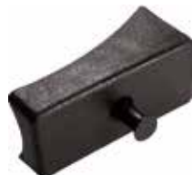
MC 30 Meia-cana curva p/ tubo 7/8" ou 1"