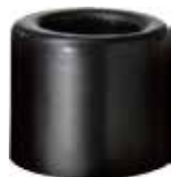
BT 01 Batente 1" PVC