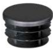
PI 131 S Ponteira 1 1/8" interna sanfonada