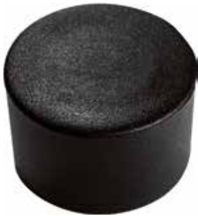
PE 78 Red. externa 7/8" PE