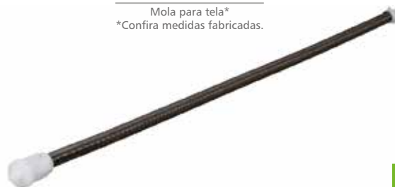
ME 22 Mola para tela* *Confira medidas fabricadas.