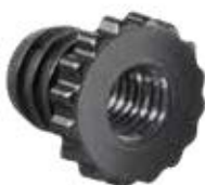
BC 40 Bucha 5/16" rosca plástica estriada