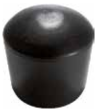
PI 114 Pont. externa 1 1/4" PVC