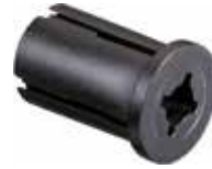
BER 34 Bucha expansiva reta 3/4"