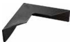
CE 30 Cantoneira 70 x 70 x 18 aberta para embalagem