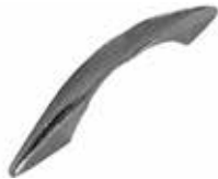
PU 50 A Puxador mesa (96 mm) prata brilhante