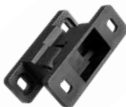
DRP 60 Dobradiça plástica p/ refrigeração