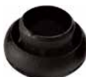
PB 340 Bola 3/4"