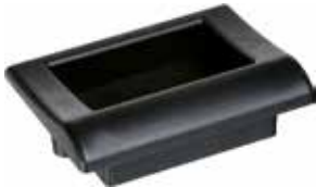
PU 40 Puxador Madri