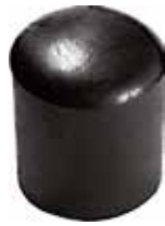
PE 12 Red. externa 1/2" PE