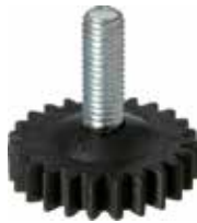
NE 15 Pé nivelador estriado M8 x 25 mm