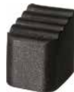
SEAE 2330 Sapata para pé de escada alumínio 30 x 23