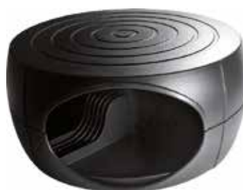
SM 100 Suporte p/ monitor