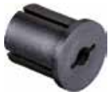
BER 1 Bucha expansiva reta 1"