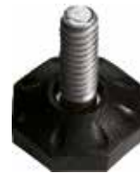
NO 10 Pé nivelador pequeno 1/4" x 3/4" (24 mm)