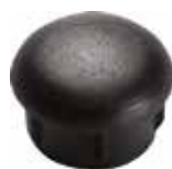
PI 130 Red. interna 1"