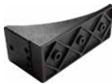
CN 80 Cantoneira painel