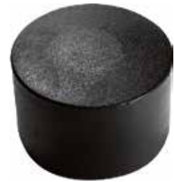
PE 114 Red. externa 1 1/4" PE