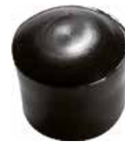
PI 580 Pont. externa 5/8" PVC