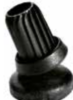
SA 34 Sapata articulada 3/4"