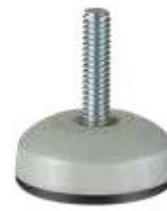
NP 400 Pé nivelador redondo plástico 1/4" x 1" (35mm) perolado